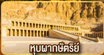
หุบผากษัตริย์