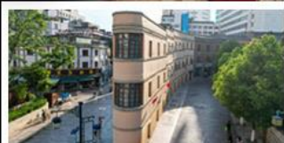
ถนนเก่าคุนหมิง