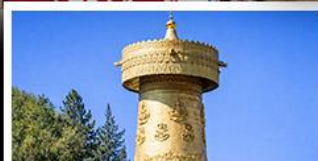
วัดต้าฝอ กงล้อมนตรา