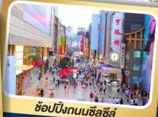
ช้อปปิ้งถนนซิลซิลู่