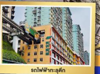
รถไฟฟ้า-ลู่ตัก