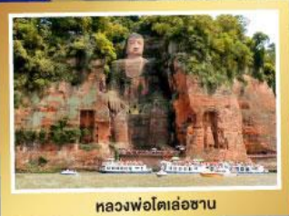
หลวงฟ่งโตเล่อซาน