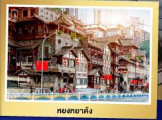
หยงหมาดิง