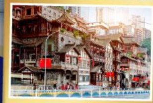
หยงหมาดิง