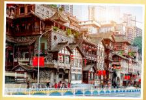
หยงหยาดัง