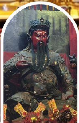
วัดกวนไท่ ขอเทพเจ้ากวนอู ความซื่อสัตย์ เงินทอง ธุรกิจมั่นคง