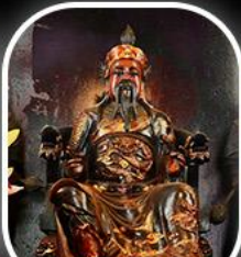
วัดปักไต่