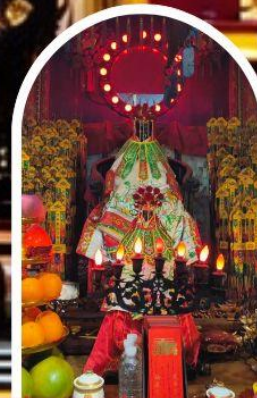
วัดเจ้าแม่กวนอิมอ่องฮำ ขอพรเรื่องเงิน ทรัพย์สิน และความมั่งคั่ง