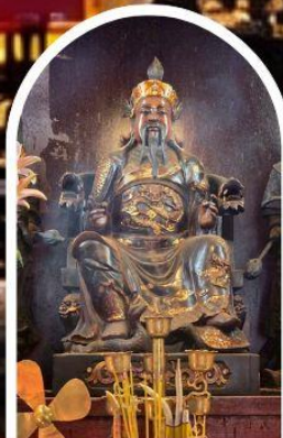
วัดปักไต้ เสริมโชคกลางนำความรุ่งเรืองทุกด้านของชีวิต