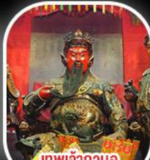
เทพเจ้ากวนอู วัดกวนไท