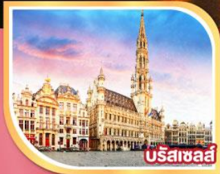
บรัสเซลส์