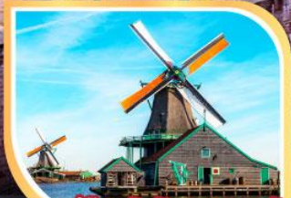
หมู่บ้านกังหันลมซานสคันส์