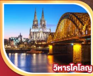
วิหารโคโลญ

01-08 ก.พ. 68 08-15, 15-22 ก.พ. 68 22 ก.พ.-01 มี.ค. 68 01-08 มี.ค. 68