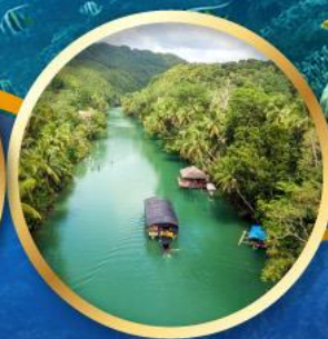
ล่องเรือแม่น้ำโลบ็อก