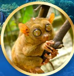
ลิงการ์เซีย