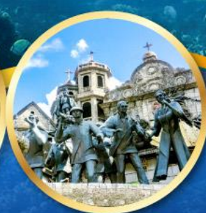
อนุสาวรีย์มรดกแห่งเซบู