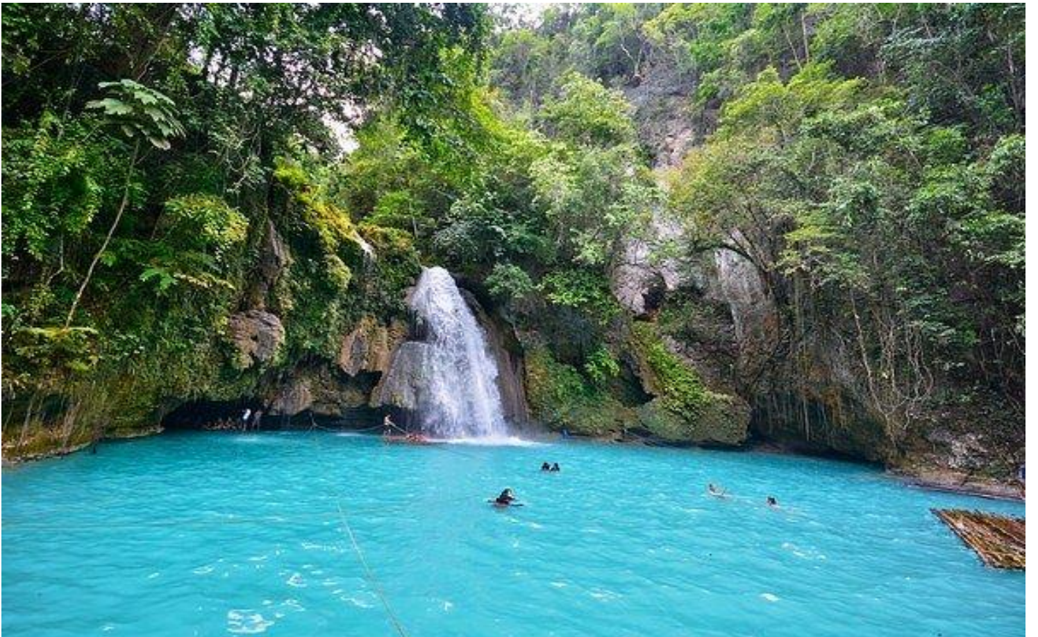
GO1CEB-5J102 CEBU Mabuhay Sea. Sand. Smile. ดำน้ำชมฉลามวาฬ เกาะโบโฮล 4วัน2คืน โดยสารการบิน Cebu Pacific (5J)