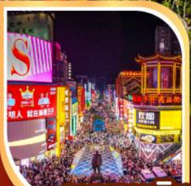
ถนนคนเดิน หวงซิงลู่