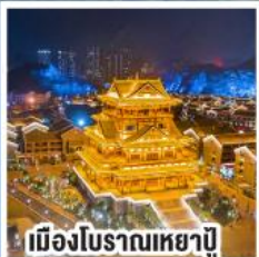
เมืองโบราณเหย่าปู้