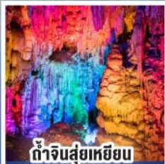
ถ้ำจินสุ่ยเหยียน