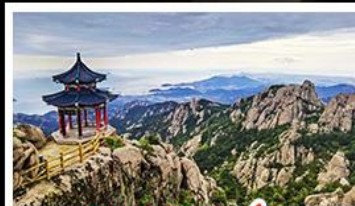
ภูเขาเลาซาน