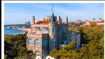
ป่าตึกวน

พระราชวังฤดูร้อน - วิวเมืองสิงเต่า รถไฟความเร็วสูง - ภูเขาเลาซาน กำแพงเมืองจีนด่านจวิยงกวน - ป่าตึกวน พักโรงแรมระดับ 4 ดาว - ไม่หลงร้านช้อปปิ้ง มือพิเศษ เปิดปักกิ่ง , หม้อไฟซีฟู้ด