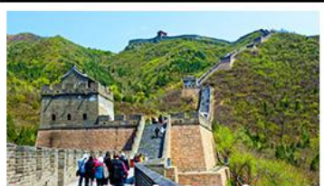
กำแพงเมืองจีนด่านจวิยงกวน