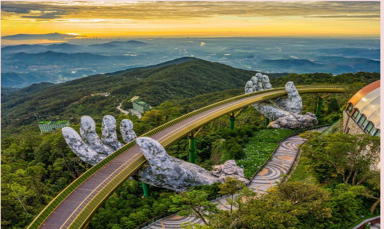
2UDAD-EK002 2U พาเช็คอิน นอนฟินๆ บานาฮิลล์ 1 คืน เวียดนามกลาง ดานัง ฮอยอัน บานาฮิลล์ 4วัน 3คืน โดยสายการบิน Emirates Airlines(EK)