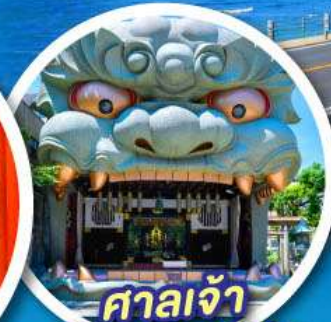
ศาลเจ้า นิมบะยาซากะ