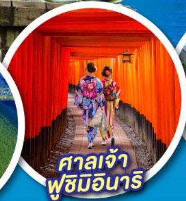
ศาลเจ้า ฟูชิมิอินาริ