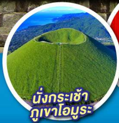
นั่งกระเช้า ภูเขาอินุโมริ

จุดชมวิวกุเอะไฟฟูจิ ป่าสนมิโฮะ โนะมัตสึบาระ