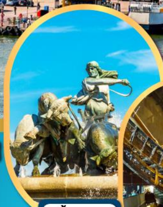
น้ำพุแห่ง ราชินีกเฟออน