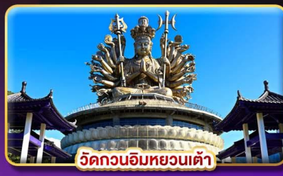
วัดกวนอิมหยวนเต๋า