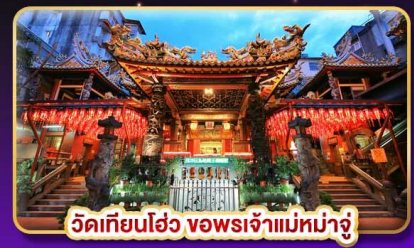
วัดเทียนโฮ่ว จอพรเจ้าแม่ทาจู