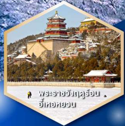
พระราชวังฤดูร้อน อี๋เหอหยวน