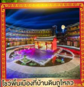
โชว์พื้นเมืองที่บ้านดินกู่ไหลอว