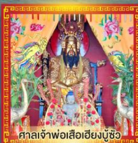
ศาลเจ้าพ่อเสือเฮียงบู๊ซิว