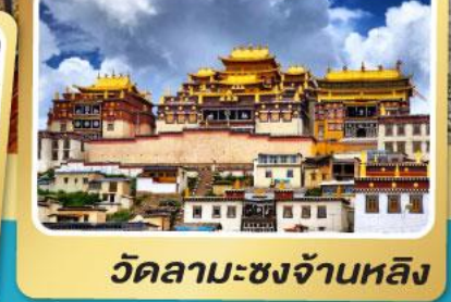
วัดลามะซงจ้านหลิง