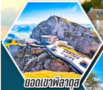
ยอดเขาพิลาตุส