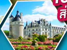
ปราสาทชองโซ

เข้าชมมหาวิหารมรดกแห่งต์มิเชล สิ่งมหัศจรรย์ของประเทศฝรั่งเศส