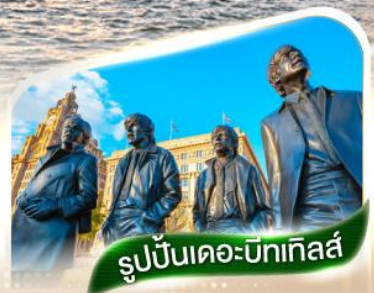
รูปปั้นเดอะบิกเทิลส์

★ตามรอยวงเดอะบิกเทิลส์และสโมสรรีเวอร์พูล ณ เมืองลิเวอร์พูล