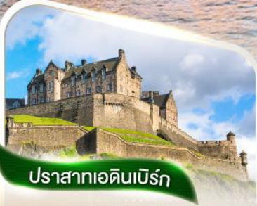
ปราสาทเอดินเบิร์ก