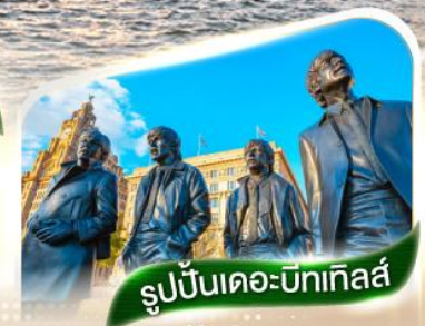
รูปปั้นเดอะบิทเทิลส์

★ตามรอยวงเดอะบิทเทิลส์และสโมสรรีเวอร์พูล ณ เมืองลิเวอร์พูล