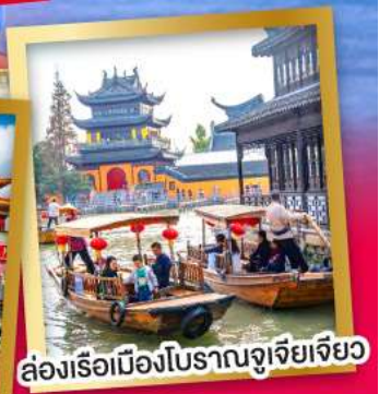
ล่องเรือเมืองโบราณจูเจียเจียว