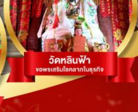
วัดหลินฟ้า ขอพรเสริมโชคกลางในธุรกิจ