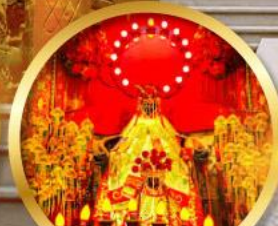
เจ้าแม่กวนอิมฮ่องกง ขอพรทรัพย์สิน ความมั่งคั่ง