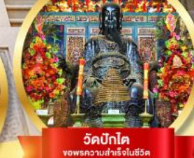
วัดปึกโต ขอพรความสำเร็จในชีวิต