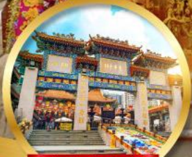
วัดหวังต้าเซียน ขอพรด้านสุขภาพ