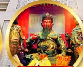
เทพเจ้ากวนอู ขอพรชื่อเสียง หน้าที่งาน ธุรกิจมั่นคง