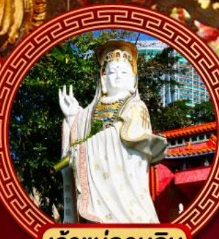
เจ้าแม่กวนอิม รีพัลส์เบย์