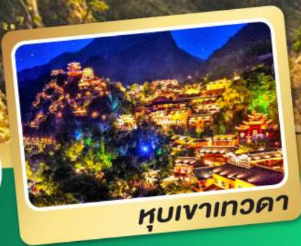
หุบเขาเทวดา