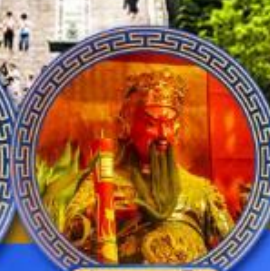
วัดกวนโถ