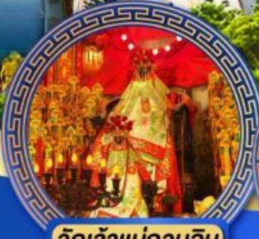
วัดเจ้าแม่กวนอิม ฮ่องกง