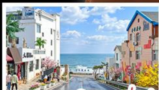
ถนนคอปเปลิ่งสาขาที่แปด