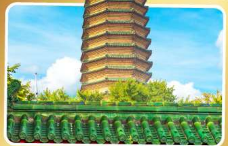
วัดพระเจี๊ยะเก้ว

เมนูพิเศษ เปิดปักกิ่ง, ซามูหม้อไฟ อาหารกวางตุ้ง, อาหารเสฉวน