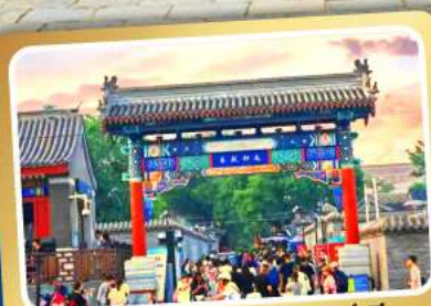
ถนนโบราณหนานหลิวกู่เซียง