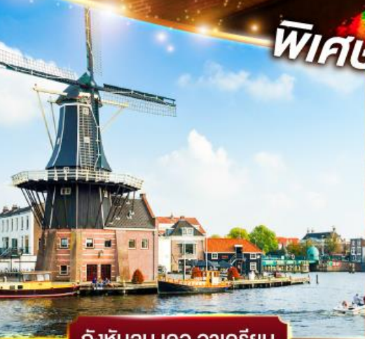
กังหันลม เดอ อาครีเยน