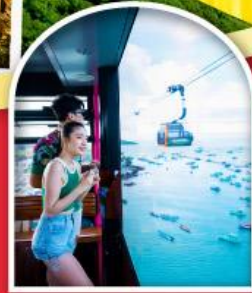
Sun World Cable Car