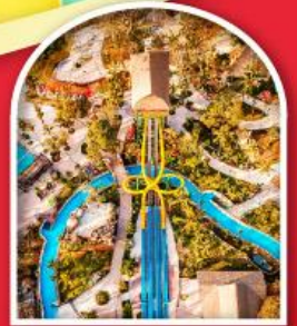
Sun World Hon Thom