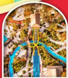
Sun World Hon Thom