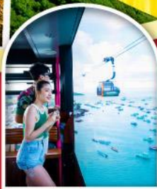
Sun World Cable Car