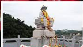
พระเจ้าตากสินมหาราช