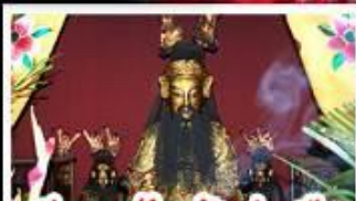
เอียงบูชิว (เจ้าพ่อเสื่อ)