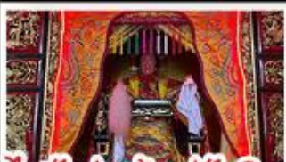
ไฮตังมา (เจ้าแม่ทับทิม)