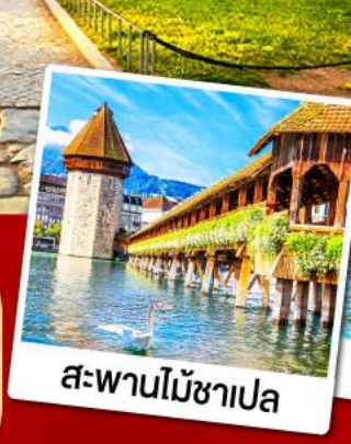
สะพานไม้ซาเปล

08-16, 15-23 มี.ค. 68 09-17 เม.ย., 31 พ.ค.-08 มิ.ย. 68 14-22 มิ.ย., 10-18 ก.ค. 68