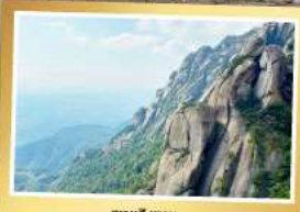
เขาหลิงซาน