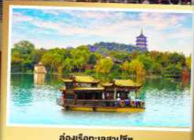
ส่องเรือทะเลสาปซีหู