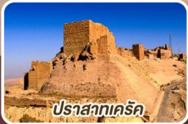
ปราสาทครีค