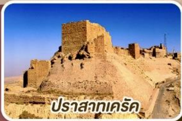
ปราสาทเคิร์ค