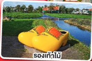
รองเท้าไม้