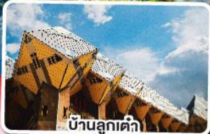
บ้านลูกเต่า