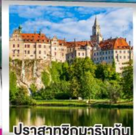
ปราสาทชิกมาริงเก้น