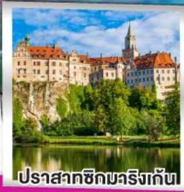
ปราสาทชิกมาริงเก้น