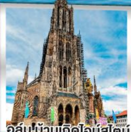
อูล์มบ้านเกิดไอน์สไตน์