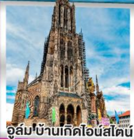
อูล์มบ้านเกิดไอน์สไตน์