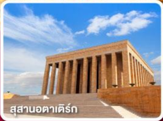
สุสานอตาเคิร์ก