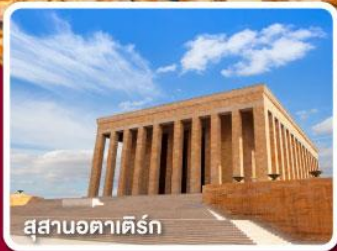
สุสานอตาเคิร์ก