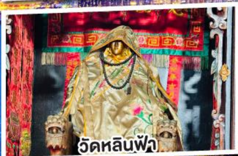
วัดหลินพัล