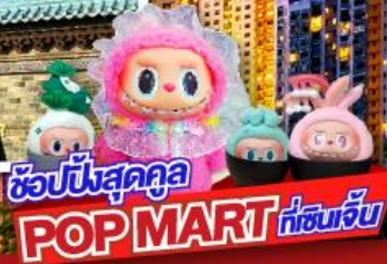
โซนนี้สุดคูล POP MART ที่เซินเจิ้น