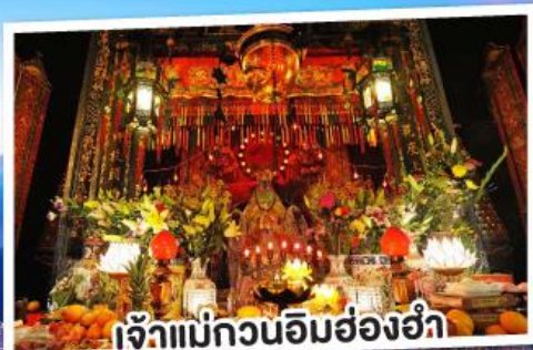
เจ้าแม่กวนอิมฮ่องอ๋า

**เงื่อนไขบินไม่รวมภาษีและค่าธรรมเนียม ความคุ้มครองเป็นไปตามกรมธรรม์ประกันภัย