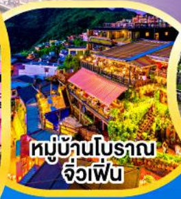
หมู่บ้านโบราณ จิวเฟิ่น