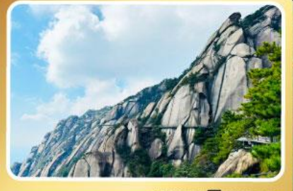
เงาหลิงซาน