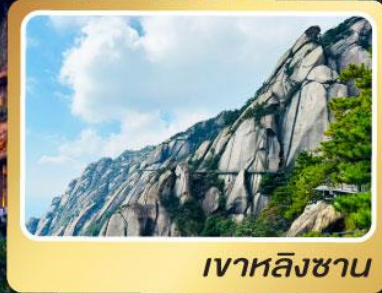
เวาหลิงซาน