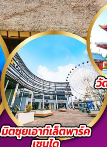
มิตซูเอากะที่เล็ดพาร์ค เซนได