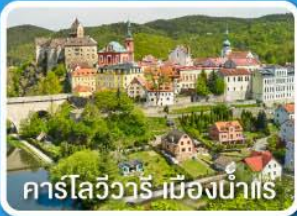
คาร์โลวารี เมืองน้ำแร่

เยอรมนี เชก สโลวัก ฮังการี ออสเตรีย 8 วัน 5 คืน