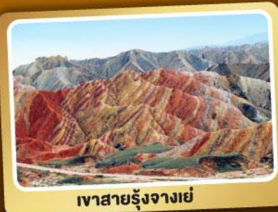
เวาสายรุ้งจางเย่