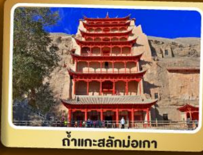
กำแพงสะลักม่อเกา