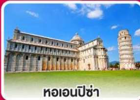
หอเอนปิซ่า