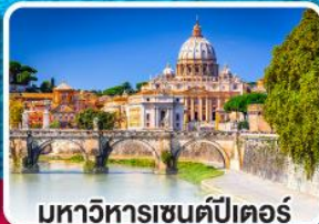
มหาวิหารเซนต์ปีเตอร์