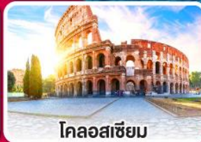
โคลอสเซียม

ลิ้มรสพาสต้า พิซซ่า และสปาเก็ตตี้ แบบต้นตำหรับอิตาลี