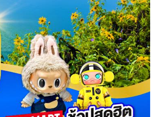
POP MART ช้อปสุดฮิต