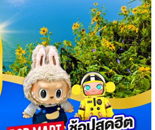
POP MART ช้อปปิ้งสุดฮิต