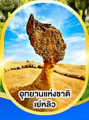
อุทยานแห่งชาติ เย่หลิว