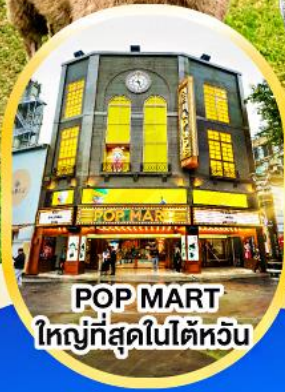
POP MART ใหญ่ที่สุดในไต้หวัน