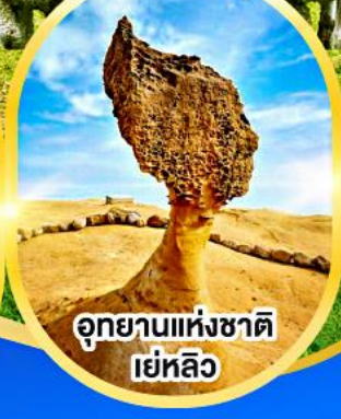
อุทยานแห่งชาติ เย่หลิว