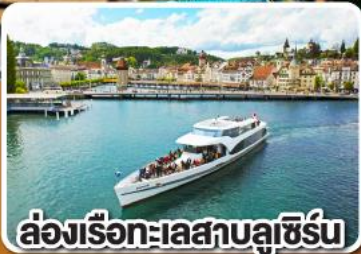
ล่องเรือทะเลสาบลูซิิร์น