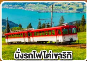
นั่งรถไฟใต้เขาโรทิก