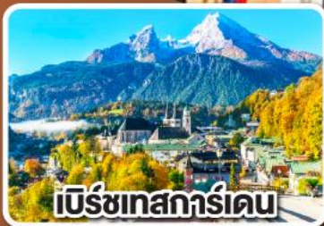
เบิร์ชเทสการ์ดเดน

เข้าชมเมืองเกลือโบราณ แห่งเมืองเบิร์ชเทสการ์ดเดน