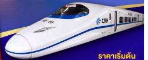
ราคาเริ่มต้น