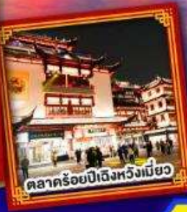
ตลาคร้อยปีถึงหวังเหมียว