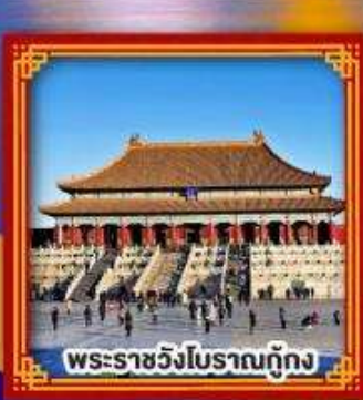
พระราชวังโบราณกรุงปักกิ่ง