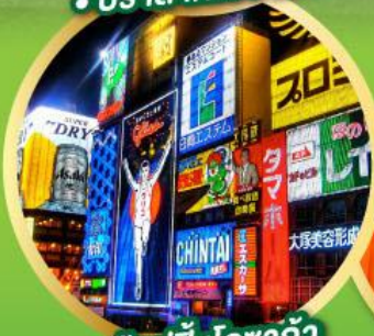
ช้อปปิ้งโอซาก้า