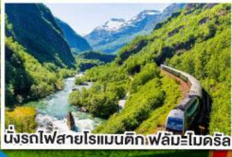
นั่งรถไฟสายโรแมนติกฟิล์มโบเดริล