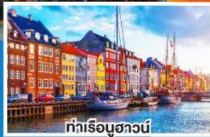
ท่าเรือฮาวน์