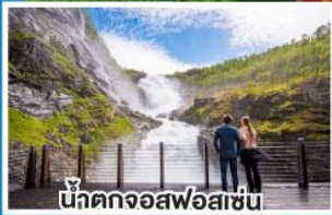
น้ำตกจอสฟอสเซ่น