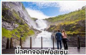
น้ำตกจอสฟอสเซน