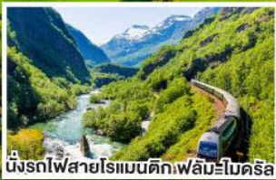
นั่งรถไฟสายโรแมนติกเฟลัมโบนคริส