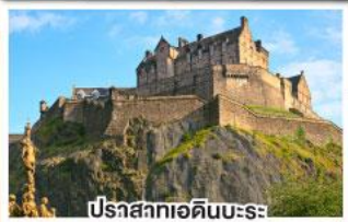
ปราสาทเอดิเนบะระ

เยือนสโตนเฮนจ์ และ พิพิธภัณฑน์โรมันโบราณ