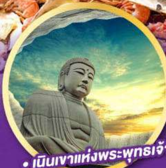
• เป็นเขาแห่งพระพุทธรเจ้า

บุฟเฟ่ต์เมลอน หอมหวานฉ่ำ เกี่ยวเต็มทุกวัน ไม่มีฟรีเคย์ พักโรงแรมในชิปปโปโร 2 คืน