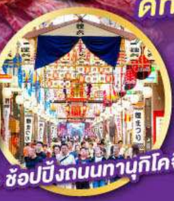
• ซุปป์ิงถนนทานุกิโคจิ