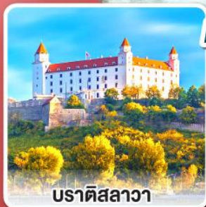
บราติสลาวา

เยือนหมู่บ้านกรีนซิง แห่งออสเตรีย พร้อมอาหารค่ำแบบ “ฮอยริเก้”และไวน์สด