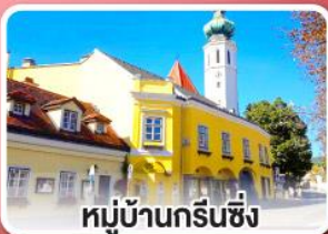
หมู่บ้านกรีนซิง